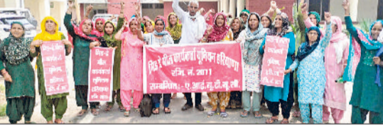
नारनौल। मांगों को लेकर नारबाजी करती मिड डे मील वर्कर।

तारीख तक भुगतान करने, स्कीम वर्कर्स को सामाजिक सुरक्षा के दायरे में लाकर पेंशन योजना व इलाज की सुविधा उपलब्ध करवाने, ड्रेस को राशि दो हजार रुपये करने, स्कूल बन्द होने की स्थिति में पास के स्कूल में समायोजन करने, रिटायरमेंट पर एकमुशत पांच लाख रुपये देने, मिड डे मील कुक कम हेलप्स को सरकारी व हटाते की नीति बनाने व यूनिन की राज्य महासचिव कुसुम पांचाल को अविलंब बहाल करने की मांग की जाएगी।