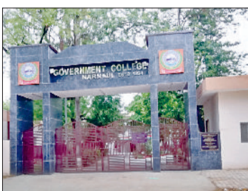
नारनौल। पीजी ब्वॉयज कॉलेज।

जिले के एकमात्र पीजी कॉलेज नारनौल में पहली बार शुरू किया गया है डिजिटल मार्केटिंग कोर्स, रोजगार के बढ़ते अवसर