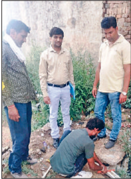
नारनौल। अवैध कनेक्शन काटती विभागीय टीम।