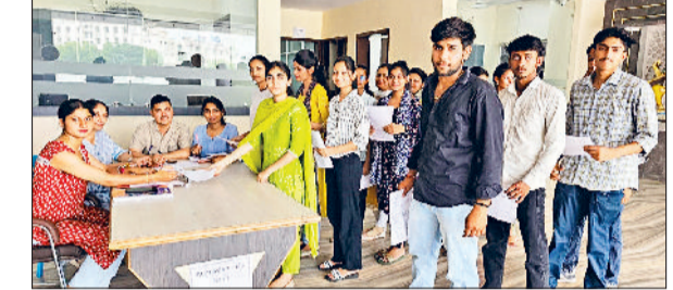
नारनौल। दाखिले के लिए कॉलेज में आए विद्यार्थी।