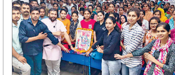
महेन्द्रगढ़। महाराणा प्रताप के चित्र पर पुष्पांजित करते हुए।