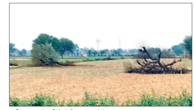
कनीना। गुद्दा में मशीनों से गिराए गए हरे पेड़।