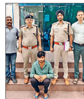
नारनौल। पुलिस गिरफ्तार में आरोपित।

खाता के खिलाफ विभिन्न राज्यों में 16 शिकायतों में कुल 44785211 रुपये का फ्रॉड होने की रिपोर्ट