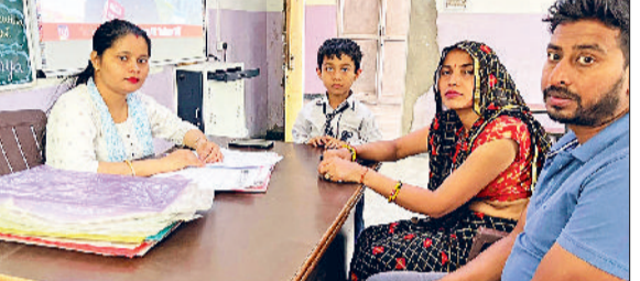
नारनौल। बैठक में भाग लेते अध्यापक अभिभावक।

नारनौल। नारनौल। शहर में मौहल्ला नई सराय के एक मकान में चोरी की वारदात हुई है। वहां लगे सीसीटीवी कैमरा में वारदात कैद हो गई। सामने आई तस्वीरों में दिख रहा है कि संदिग्ध मकान की दीवार का फांदकर सामान चोरी कर रहा है। इसके बाद मकान मालिक ने पुलिस को सूचना दी। पीड़ित मकान मालिक मुकेश कुमार ने बताया कि बीती रात उसके मकान से चोरी हो गई। इसके बाद कठिन चुनौतियों के उसके घर में कुएं की मोटरों के पाइप, तार व अन्य सामान रखा हुआ है। बीती रात को एक चोर उसके घर में दीवार फांदकर घुस गया। जिसके बाद उसने करीब तीस से 40 हजार रुपये के सबमर्सिबल पाइप, तार तथा अन्य सामान चुराकर ले गया। उन्होंने बताया कि चोरी करने के बाद वह वहां से सामान को दीवार के ऊपर से ले गया।