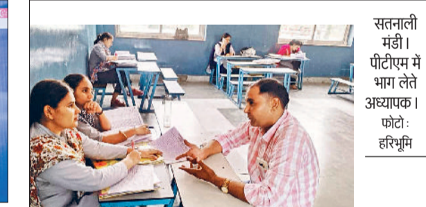
सतनाली मंडी। पीटीएम में भाग लेते अध्यापक।

उसके उज्वल भविष्य की कामना की और भविष्य में जिले का प्रतिनिधित्व करने के लिए अग्रिम शुभकामना दी। उन्होंने बताया कि कराटे प्रतियोगिता में भाग लेना विद्यार्थियों के लिए कई तरह से महत्वपूर्ण है। यह शारीरिक और मानसिक दोनों तरह से लाभ पहुंचाता है, जिससे वे अपने जीवन में बेहतर प्रदर्शन करने के लिए तैयार होते हैं।